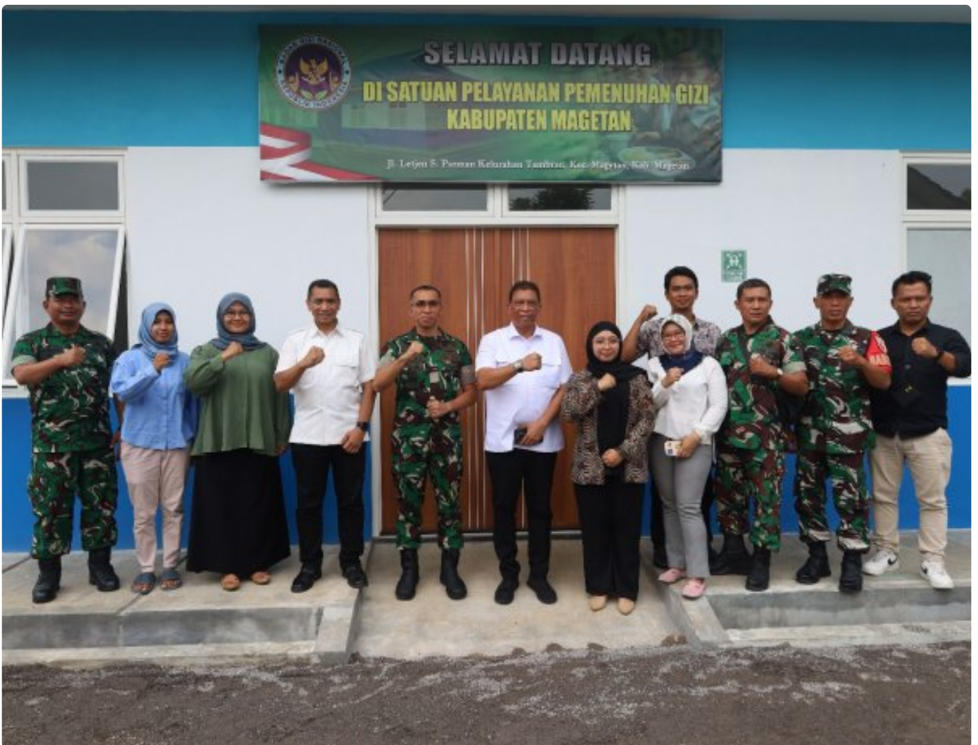
Dandim 0804/Magetan Dampingi Kunker Dan Peninjauan Tim Badan Gizi Nasional